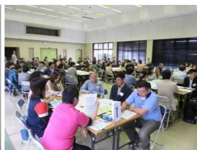
写真は 第3回の様子